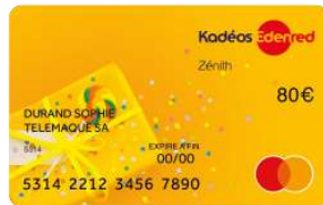
Carte Kadéos Zénith