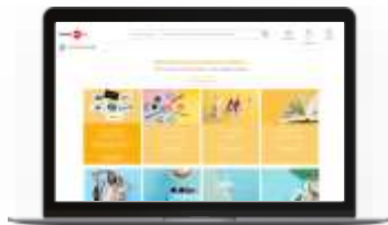
Boutique Kadéos Connect

En magasin ou en ligne, vos collaborateurs se font plaisir quelque soit le support