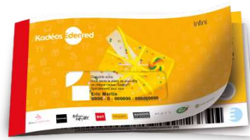
Chèque Kadéos Infini